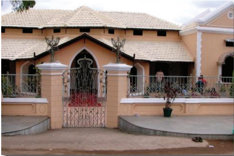
जन्म स्थान छिंदवाडा (म.प्र.) 21 मार्च, 1923

परमपूज्य श्री माताजींना स्वतः जवळ असलेल्या अध्यात्मिक ज्ञानाची माहिती लहानपणापासूनच होती. या माहितीच्या आधारे मानवजातीला संघर्ष व असुरक्षिततेपासून मुक्तता मिळवून निरोगी व आनंदी आयुष्य जगात येईल. याबद्दल ठाम विश्वास होता. श्री माताजींच्यामध्ये संपूर्ण मानवजातीला परिवर्तन करण्याचे गुण असल्याचे त्यांच्या वडिलांना माहित होते. श्री माताजींनी त्यांच्या कौटुंबिक जबाबदाऱ्या पार पाडताना मानवाचे दुःख व भय यांच्या त्रासातून मुक्तता मिळविण्याच्या विविध उपायांचा अभ्यास केला. ५ मे १९७० ला श्री माताजींनी सहजयोगाची स्थापना केली. या सहजयोगाद्वारे प्रत्येक मानवात निद्रीस्त असलेली कुंडलिनी शक्ति जागृत करत आत्मसाक्षात्कार प्राप्त करता येतो. या वास्तविकतेला स्व-तंत्र (स्वातंत्र्य) म्हटले. म्हणजेच स्वतःला जाणून घेण्याचे तंत्र म्हणून संबोधित केले. सर्वव्यापी परमेश्वरी शक्तिबरोबर एकरूप होण्याची शुद्ध इच्छा व्यक्त करणे हा कुंडलिनीचा गुण आहे. आत्मसाक्षात्कार मिळविणे हा सर्वांचा जन्मसिद्ध हक्क आहे. श्री माताजींनी १९७० ते २०११ पर्यंत संपूर्ण जगभर प्रवास करून आत्मसाक्षात्कार देण्याचे निरंतर कार्य केले. श्री माताजींना नोबल पिस प्राईझसाठी नामांकन मिळाले. व संपूर्ण जगभरातून असंख्य पुरस्कार व मानसन्मान मिळाले. त्यांनी नवी मुंबई येथे संपूर्ण आरोग्य व संशोधन केंद्र स्थापनाने असहाय्य स्त्रिया व मुले यांच्यासाठी दिल्ली येथे निवासस्थानाची स्थापना केली शास्त्रीय कला व संगीत जोपासण्यासाठी आंतरराष्ट्रीय म्युझिक अँकेडमी वैतरणा येथे स्थापना केली तसेच आंतरराष्ट्रीय शैक्षणिक संस्था स्थापन केल्या.