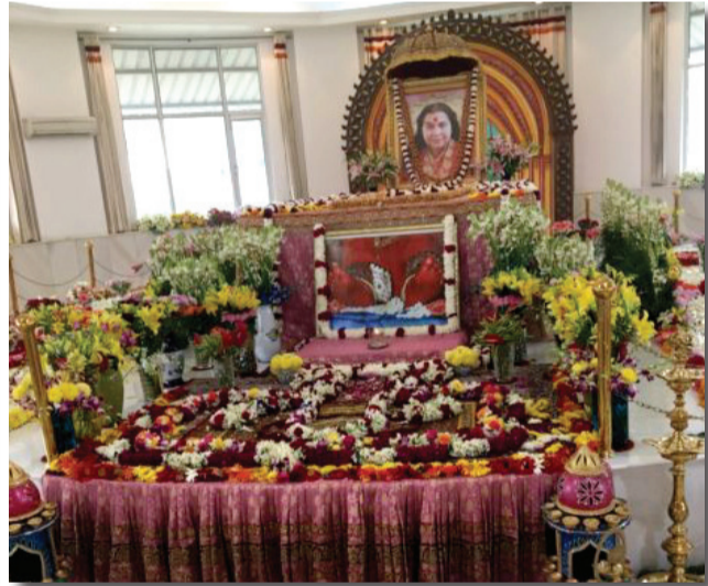
निर्मल धाम दिल्ली (महासमाधि) 23 फरवरी, 2011