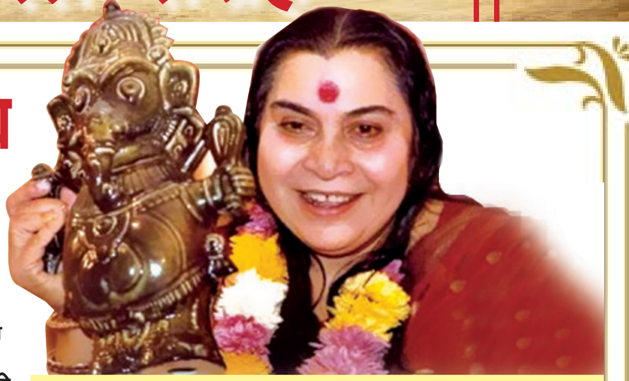
परम पुज्य श्री माताजी निर्मला देवी (सहज योगाच्या संस्थापिका) कुंडलिनी जागृतीद्वारे आत्मसाक्षात्कार

सहज योग प्रणेत्या परम पूज्य आदिशक्ती माताजी श्री निर्मला देवी यांनी संपूर्ण विश्वात भारतीय संस्कृतीचा प्रचार प्रसार केला. आपल्या संस्कृतीचा अविभाज्य घटक म्हणजेच श्रीगणेश. त्यांनी विश्वातील तमाम साधकांना श्रीगणेशाचे महात्म्य, त्याचे आपल्या मधील स्थान आणि त्याला आपल्या मध्ये कसे जागृत करावे यासंबंधी विस्तृत मार्गदर्शन केले. तसेच विश्वातील लाखो साधकांमध्ये श्रीगणेश तत्त्व जागृत केले. परिणामी आज जगातील लाखो साधक श्री गणेशाची पूजा आणि आराधना करीत आहेत. इतकच काय तर ज्यांना गणपतीतला 'ग' सुद्धा कळत नव्हता असे परदेशातील साधक आज श्रीगणेश अर्धवर्षाचा पाठ करतात.