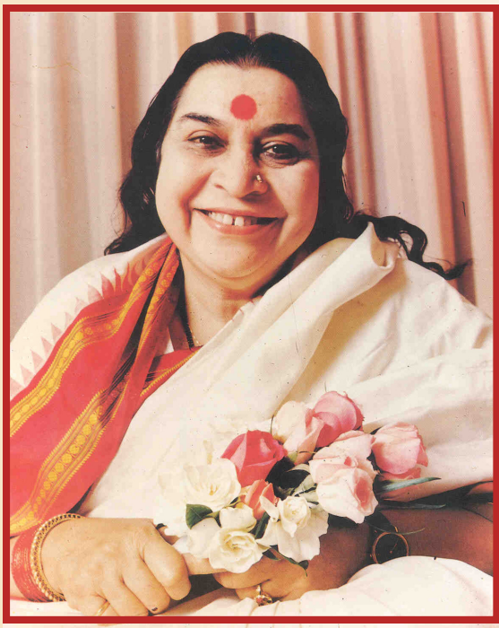
परम पूज्य श्री माताजी निर्मला देवी संस्थापिका, सहज योग ध्यान